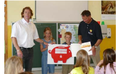
Scheckübergabe Deutsches Sportabzeichen Schulklassenwettbewerb; Schule am See (2019)